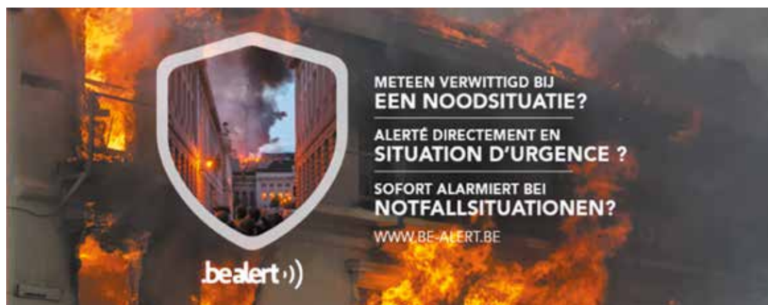
PLATE-FORME BE-ALERT: INSCRIVEZ-VOUS!